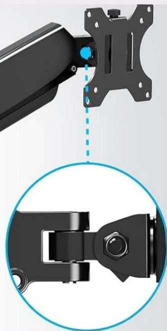
Screen rotatable at will